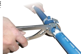
エスロハイパー-AW かんたんクランプ