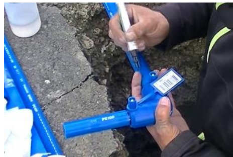
青ポリの給水管採用事例（静岡県）