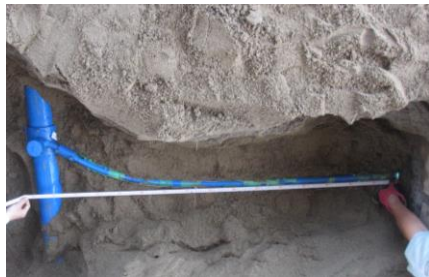
配水管の滑りに対する評価

積水化学では、地震発生時に給水管に発生する応力、ひずみなどの影響を検証。給水装置の耐震化に関する研究を進めています。