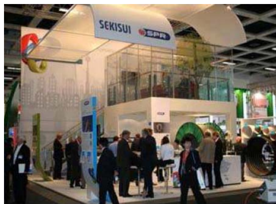
地下インフラ設備をイメージしたブース