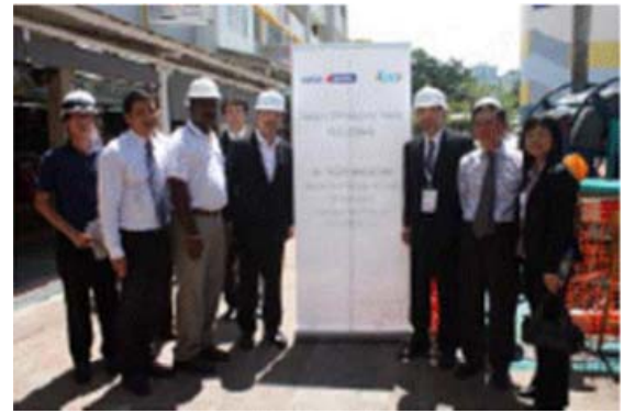
SPR 工法工事現場視察