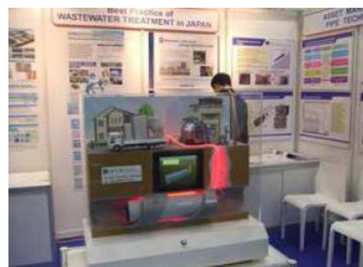
SPR 工法模型（GCUS ブース）