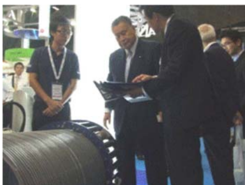
SPR工法製管デモ視察(森喜朗代表)