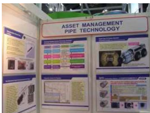
東京都下水道局とアセットマネジメント紹介

下水道グローバルセンター（GCUS）ブースでは、東京都下水道局との官民連携により、アセットマネジメントを紹介。SPR 工法を官民連携による成功事例として、模型にて分かりやすく紹介頂きました。