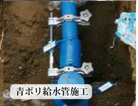
青ポリ給水管施工