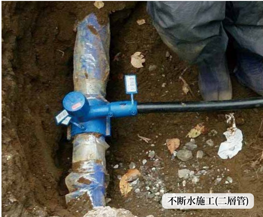
不断水施工(二層管)