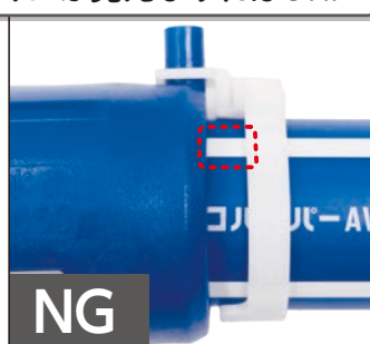
切削(スクレープ)未実施