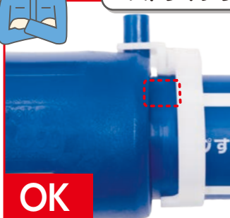
切削(スクレープ)実施済