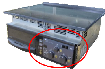
写真1, 製品本体外観